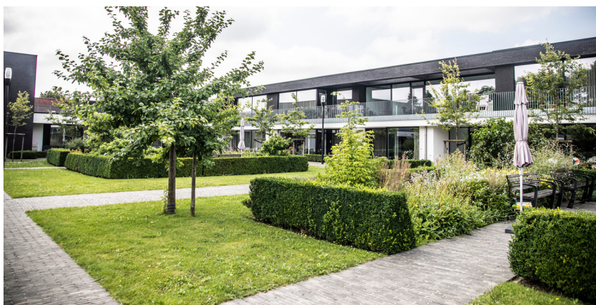
Heerlyckheid Hoog Mosscher

Een woonassistent staat tot jouw dienst voor vragen in verband met hulp- en dienstverlening. En je kan beroep doen op extra zorg zoals Thuiszorgdienst Phebe, Familiehulp, kinesithérapie, ... Er is ook de mogelijkheid om te genieten van een dagverse maaltijd van wzc De Pottelberg; samen in het restaurant of geleverd in je eigen flat. Je kan ook bij ons terecht wanneer je behoefte hebt aan een gesprek rond levensvragen. Bewoners die niet langer in de flat kunnen verblijven omdat ze permanent hulp nodig hebben, krijgen voorrang bij een opname in het woonzorgcentrum.