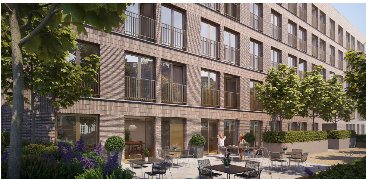
Foto Residentie Residentie 14 Van Schoonbeke ANTWERPEN