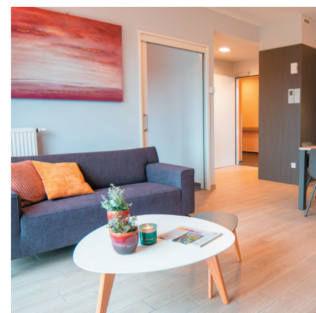
P.3: Wonen: Ontdek onze assistentiewoningen