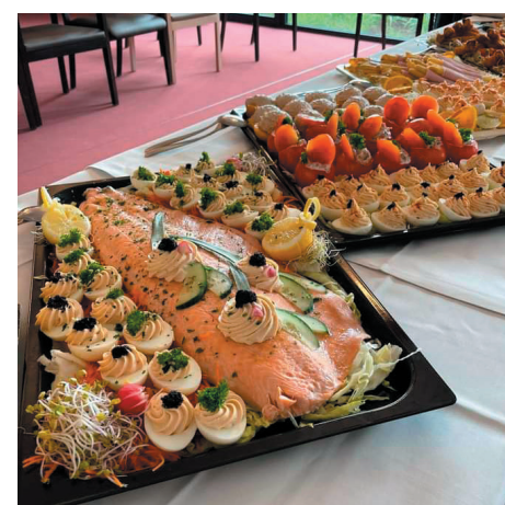
P.5: Beleven: Jouw dag, jouw ritme