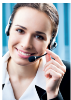
Onthaal en assistentie

U kan zelf uw dienstenpakket à la carte samenstellen, zonder verplichting en helemaal volgens uw persoonlijke wensen.